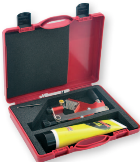
Bộ FBS - 1722 0